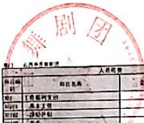
一般公共預算財政撥款支出決算表（二）